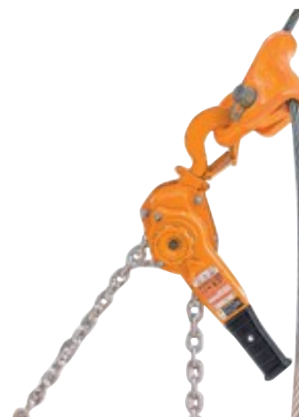
キトークリップ キトークリップ使用例